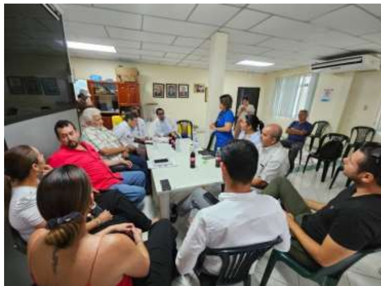
Regulación de centros de faenamiento y Venta de Productos Cárnicos, reforma al Libro V de Ambiente y Sostenibilidad.