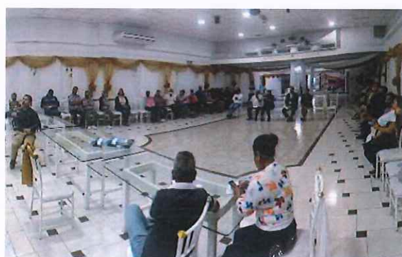
Parroquia Eloy Alfaro