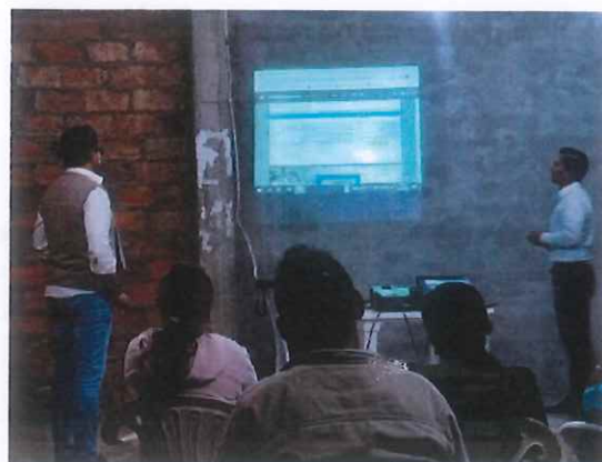
Parroquia San Loren