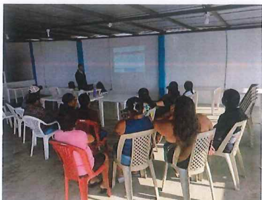
Parroquia San Mateo