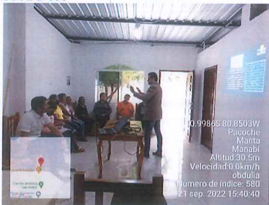
Parroquia Santa Marianita