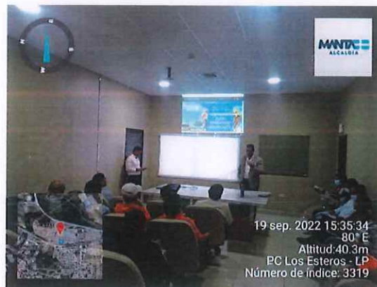
Parroquia Los Esteros