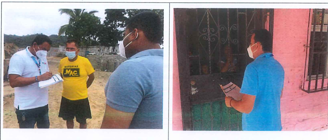
Firmas responsables de socialización