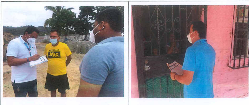
Firmas responsables de socialización